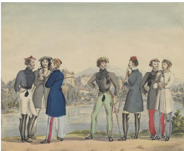
Würzburger Studenten (um 1820)